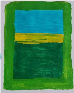
Abstraction et Mark Rothko, acrylique

Initiation à l'histoire de l'art par l'image et la connaissance. Ce temps valorise le regard des enfants sur les œuvres choisies, il leur permet d'échanger à partir de ce qu'ils ressentent et ce qu'ils connaissent.