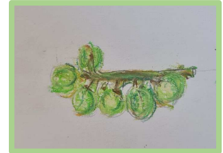
Ombres et lumières, la nature morte, pastel